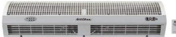
Isıtıcı Hava Perdesi