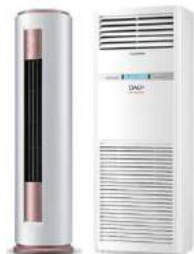
OLE-24 FSDSM / OLE-48 FSDCHM-T

13- Toplu işlerde ve uzun borulamalarda OAC İklimlendirme A.Ş. İndirim talebinde bulunabilir.